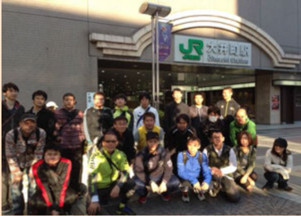
スタート地点の「大井町駅」